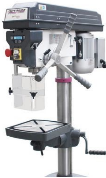
Tischbohrmaschine mit Keilriemenantrieb / 3003020